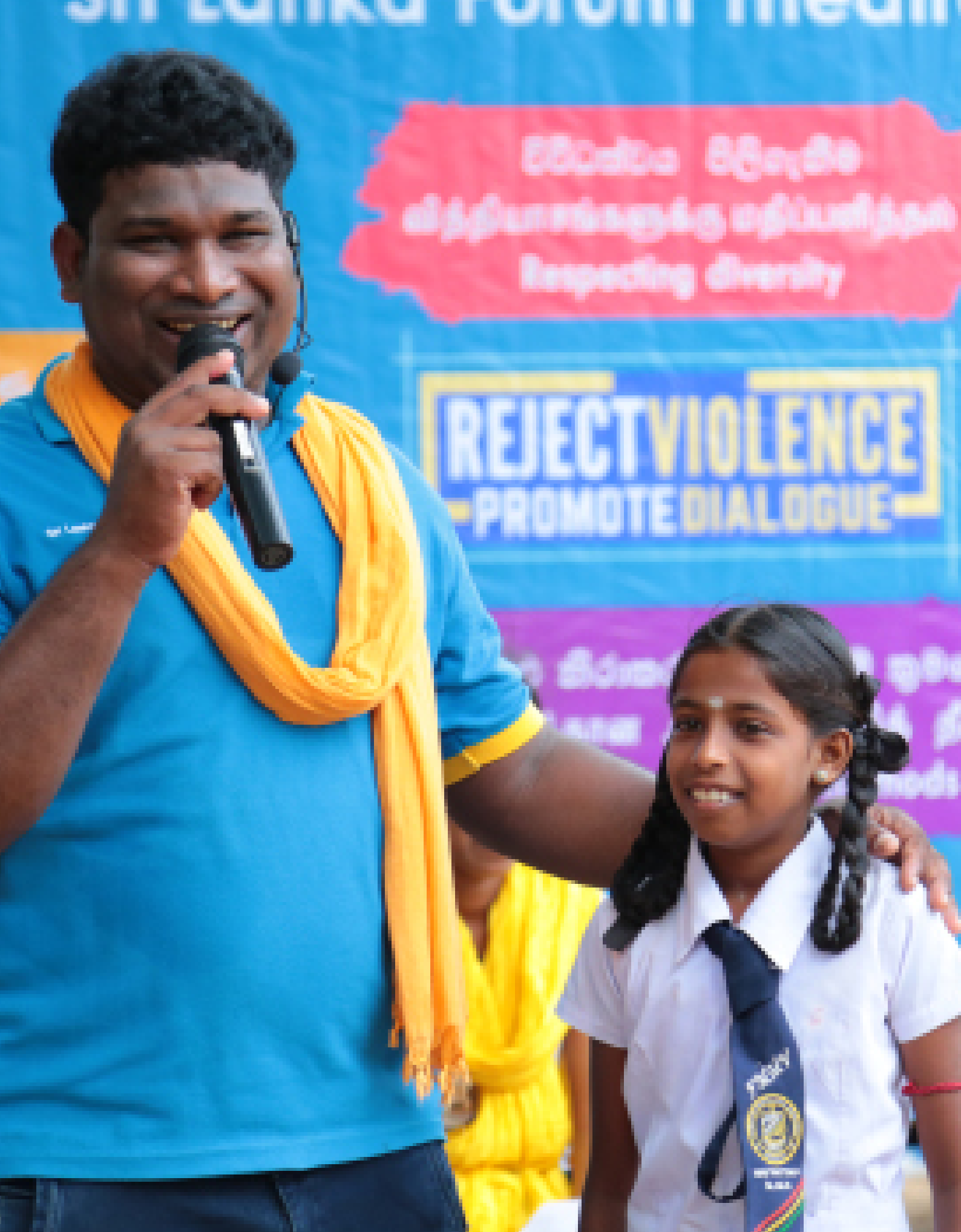
Picture 13: Sri Lanka Forum Theatre Programme - Phase IV / Mannar District / Photo by: Mohammedu Aswer