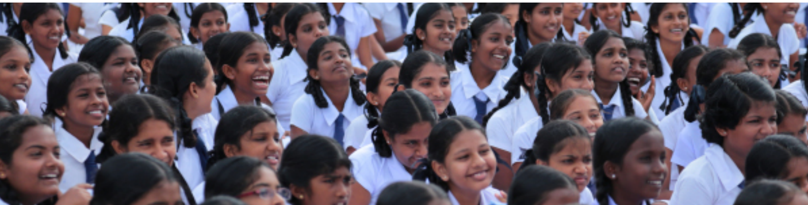
Picture 17: Sri Lanka Forum Theatre Programme - Phase IV / Mannar District

தகவல்களைத் தொகுத்தல் என்பது வெவ்வேறு மூல வழிமுறைகளினூடாக நீங்கள் பெற்றெடுத்த தகவல்களைக் கொண்டு ஒரு அர்த்தமுள்ள ஆவணமாக மாற்றி எடுக்கும் செயன்முறையாகும். இந்தப் படிமுறையின் போது அணியானது இந்தச் செயன்முறையில் பங்கெடுத்த உறுப்பினர்களுடன் தகவல்களைப் பரிமாற வேண்டி இருக்கும். MS Excel, SPSS, போன்ற மென்பொருட்கள் நீங்கள் சேரித்த தகவல்களை ஆவணமாக்கும் இந்த நிகழ்ச்சிக்கு பெரிதும் துணை புரியும்.