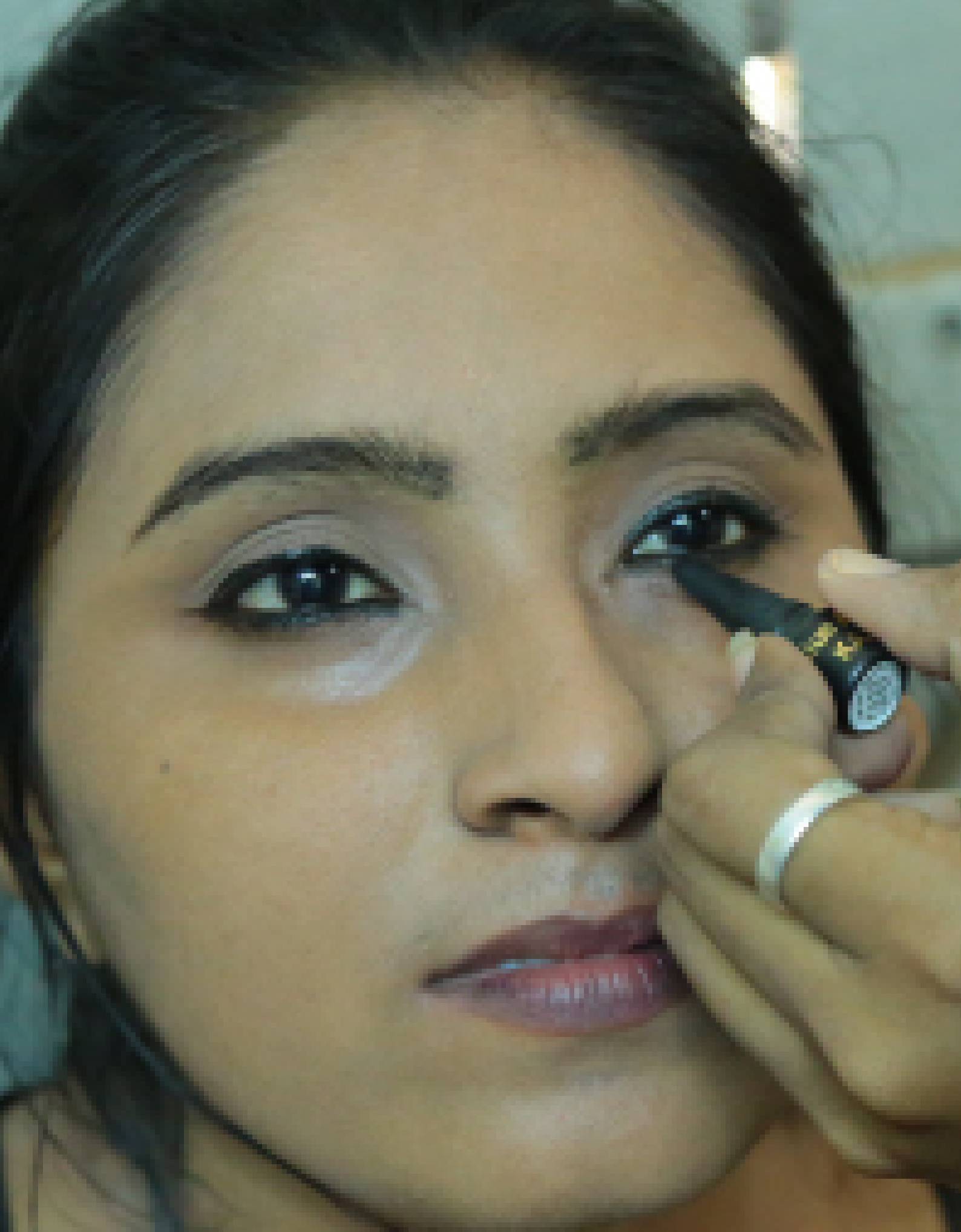
Picture 19: Sri Lanka Forum Theatre Programme - Phase IV / Vavuniya District