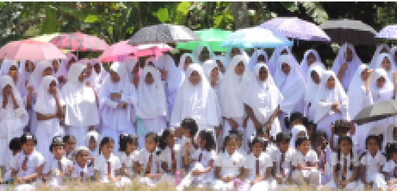
Picture 05: Sri Lanka Forum Theatre Programme - Phase II / Kandy District / Photo by: Mohammedu Aswer

சட்டவாக்க அரங்கானது புதிய சட்டங்களை அறிமுகப்படுத்தவும் கீருக்கின்ற சட்டங்களில் மாற்றங்களைக் கொண்டு வரவுமான மக்கள் அரங்கின் ஒரு வடிவமேயாகும், இங்கே சட்டத்தரணிகளும் கொள்கை வகுப்பாளர்களும் அழைக்கப்பட்டு பார்வையாளர்களாக கீருத்தப்படுவதன் காரணமாக அவர்களால் கொள்கை வகுப்புக்குத் தேவையான விபரங்களைப் பிரித்தெடுக்க முடிகிறது. அது சட்டவாக்க செயற்பாட்டின் போது சமூகத்தின் மீது நேரான பிரதிபலிப்புக்களைச் செய்கிறது.