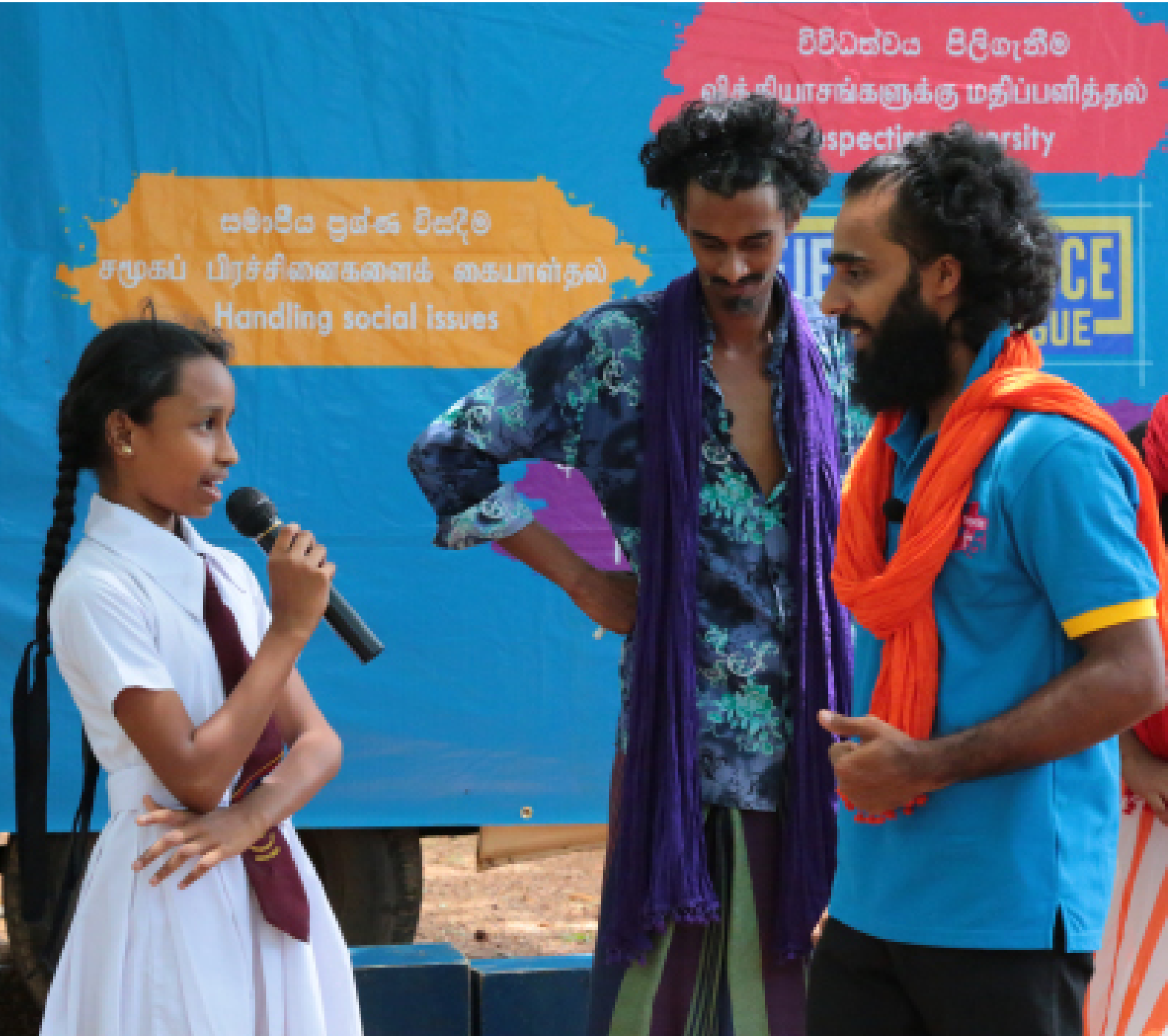
Picture 08: Sri Lanka Forum Theatre Programme - Phase IV / Vavuniya District / Photo by: Alexanthar Kamilas