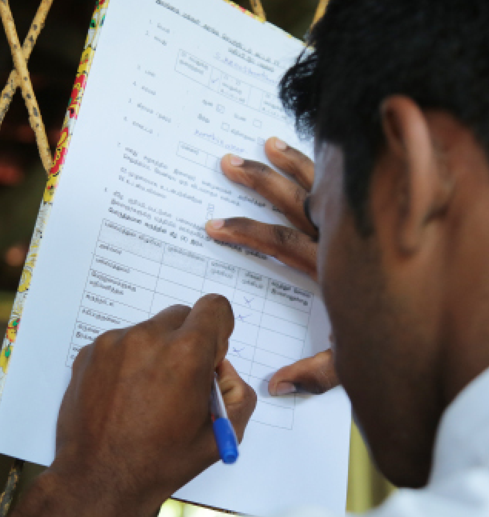
Picture 20: Sri Lanka Forum Theatre Programme - Phase IV / Vavuniya District

மக்கள் அரங்க செயற்றிட்டத்தை மதிப்பிடுவதற்கு திட்டவட்டமான ஒற்றை முறை ஒன்று இல்லை. முழு இயல்பையும் இலக்குகளையும் செயற்றிட்ட கால எல்லையையும் பொறுத்து ஒருவர் புதியதொரு மதிப்பீட்டு முறையினை மக்கள் அரங்க செயற்றிட்டத்துக்கு முன்வைக்க முடியும்.