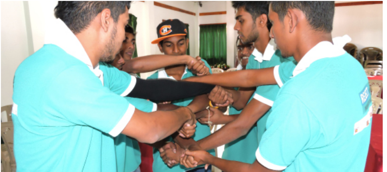
Picture 16: Sri Lanka Forum Theatre Programme - Phase II / Training Workshop

அடித்தள வரைபடி, குழு உரையாடல்கள், ஆவண மீளாய்வுகள், தனிப்பட்ட நேர்காணல்கள், நேரடி அவதானங்கள், SWOT (பலம், பலவீனம், வாய்ப்பு, சவால்) பகுப்பாய்வு போன்றன அவற்றின் உண்மையான தேவைகளை அறிந்து கொள்ளும் கருவிகளாகப் பயன்படுத்தப்படுகின்றன.