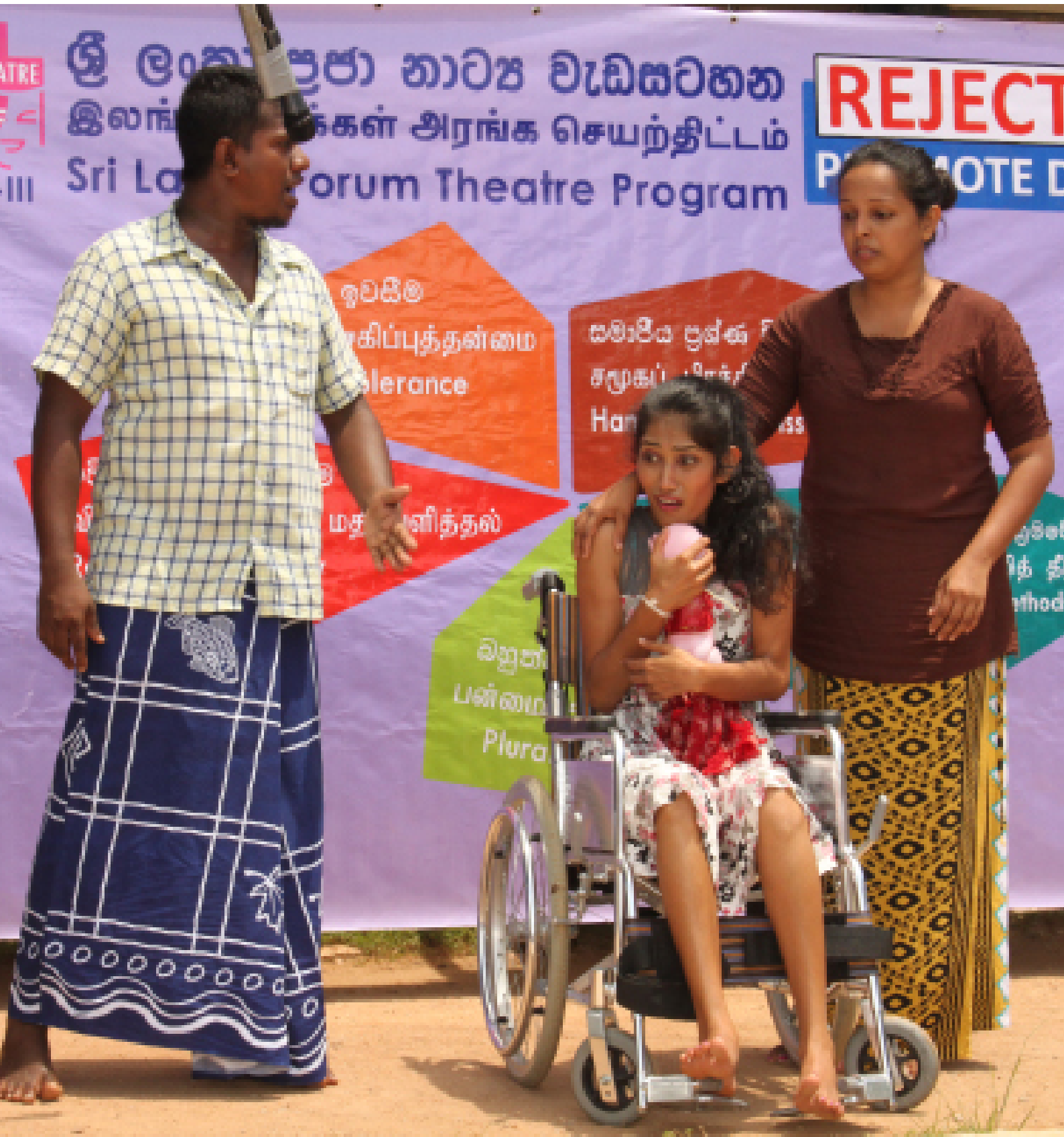
Picture 13: Sri Lanka Forum Theatre Programme - Phase III / Kalutara District