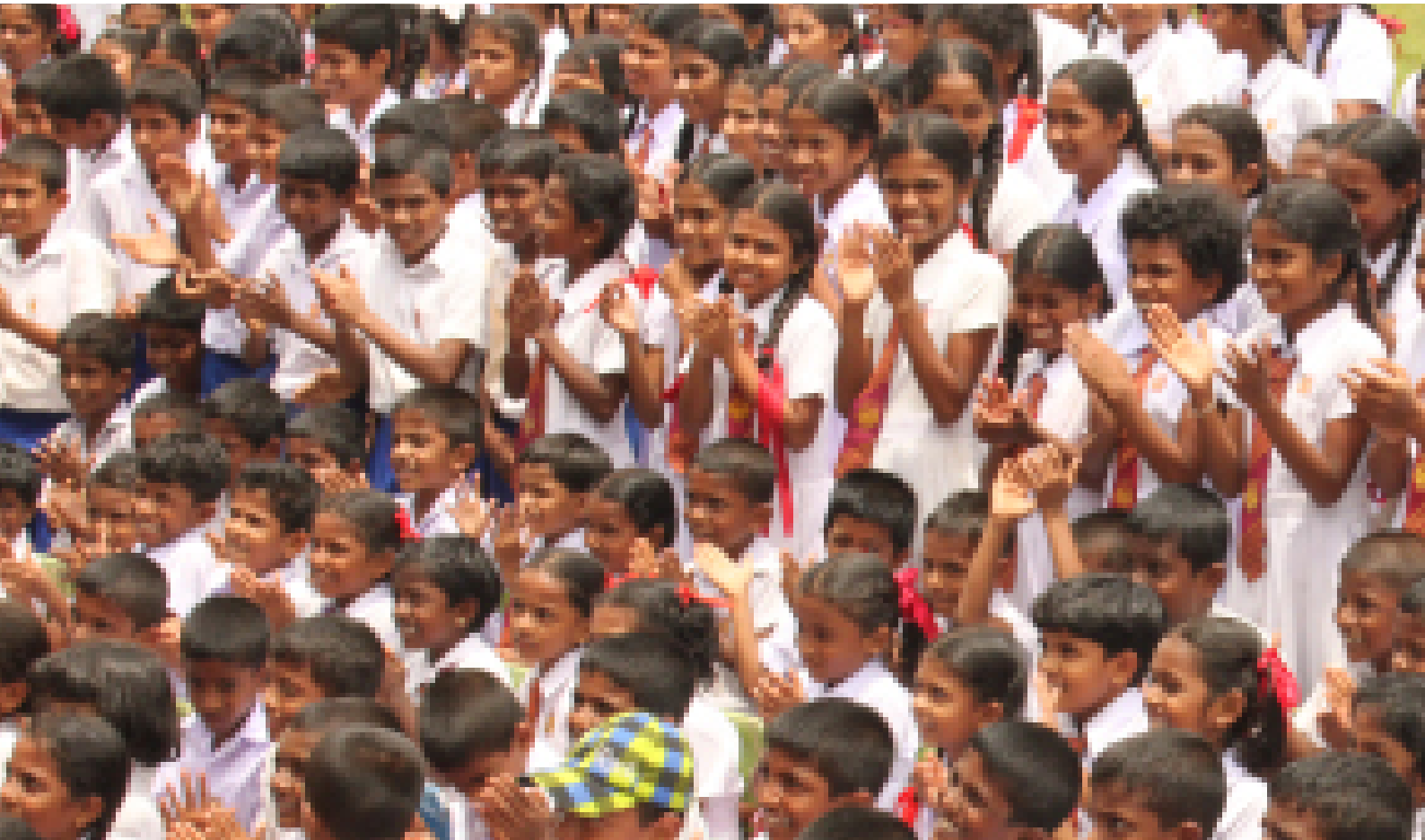
Picture 07: Sri Lanka Forum Theatre Programme - Phase III / Galle District

பார்வையாளர்கள் தங்களின் வாழ்வின் அனுபவங்களை கதைகளைப் பகிர்ந்து கொள்ள அதை நாடகமாக அரங்கில் நடிக்க நடிக்காளால் அளிக்கை செய்யப்படுகிறது.