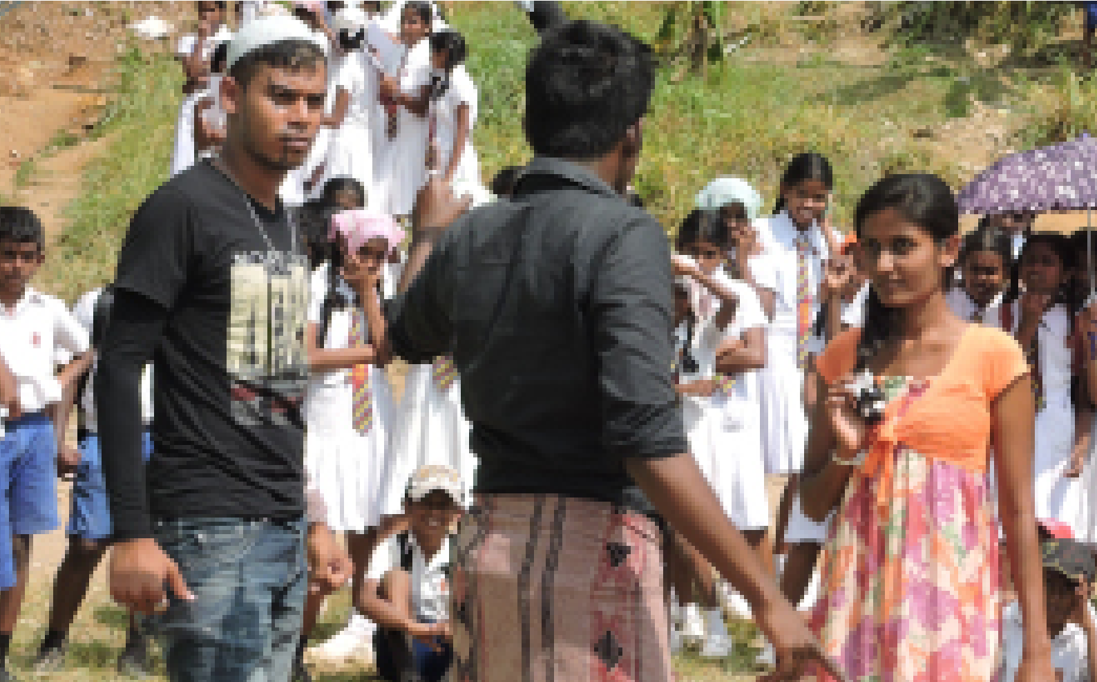
Picture 06: Sri Lanka Forum Theatre Programme - Phase II / Kandy District

பட அரங்கானது அசைவற்ற படங்களினூடாக மக்கள் மத்தியில் யதார்த்தத்தைப் போலச் செய்கிறது. இதனால் மக்கள் முன்வைக்கப்படுகின்ற பிரச்சனையைத் தூங்கள் விவரணம் செய்யும் வாய்ப்பைப் பெறுவதோடு உரையாடலிலும் அதீத ஆர்வம் கொள்கிறார்கள்.