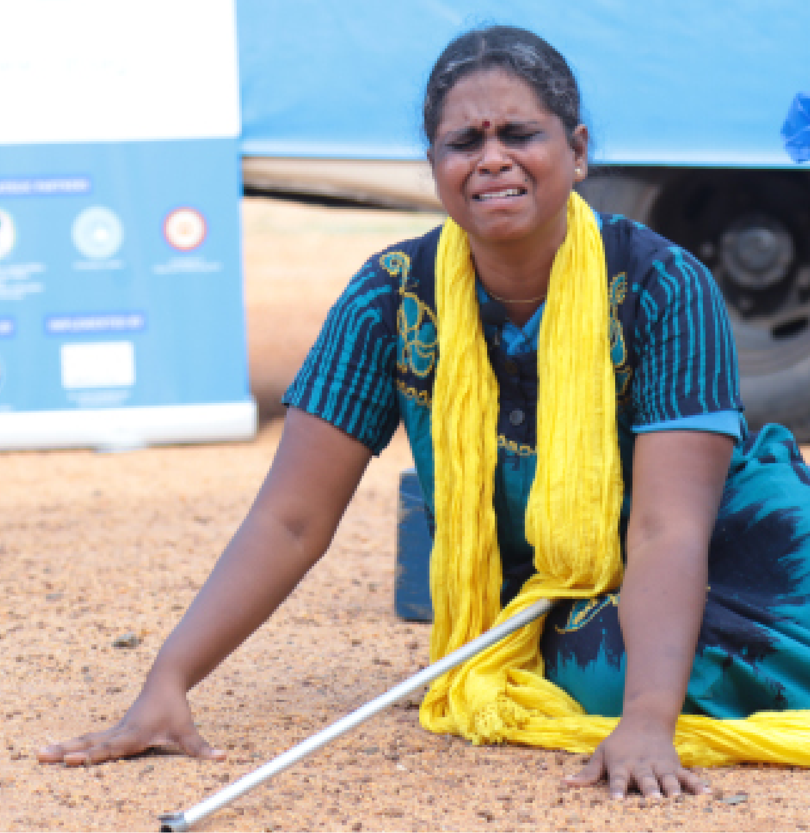
Picture 03: Sri Lanka Forum Theatre Programme - Phase IV / Mannar District