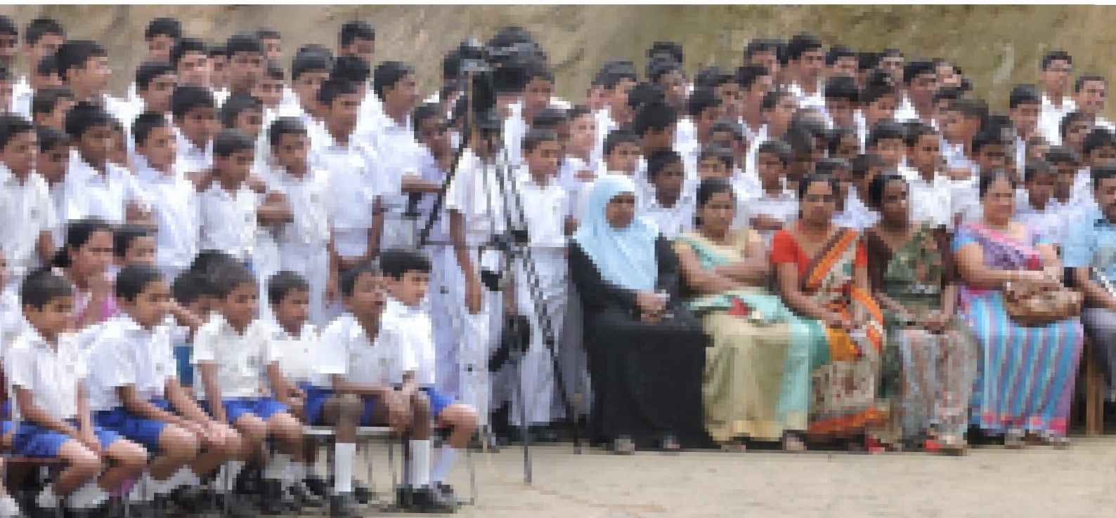
Picture 09: Sri Lanka Forum Theatre Programme - Phase II / Kandy District / Photo by: Mohammedu Aswer

அவர்களுக்கு பாரபட்சம் என்பது பிழையானது என அறிந்து கொள்ளுமளவு சமூக மனப்பாங்கு இல்லாமல் இருக்கலாம். இவ்வாறான சூழ்நிலைகளில் குரலற்ற பலமற்ற மக்களே பாதிக்கப்பட்டவர்களாக மாறுகின்றனர். எப்போதும் ஒடுக்கு முறையை எதிர்கொள்பவர்கள் பாரபட்சம், சமத்துவமின்மை, முரண்பாடு மற்றும் கருத்துரிமைக்கான இடம் இன்மை போன்றவற்றினால் பாதிக்கப்பட்டவர்களாகவே இருப்பர். ஒடுக்குமுறை என்பது சமூகத்தில் எங்குமே காணக் கிடைக்கின்ற மனித வாழ்வின் ஒரு பொதுவான யதார்த்தமாகும். கண்டடைதல் முறைகளினூடாகவும் விவாதங்களினூடாகவும் மக்கள் அரங்கானது பாரபட்சம், சமத்துவமின்மை, வன்முறை, மற்றும் குரலற்றிருத்தல் போன்றவற்றைக் கையாளுவதில் நல்ல மாற்றங்கள் ஏற்படுத்துவது குறித்த ஒரு வலுப்படுத்தல் அறிவை வழங்க முடியும். அதே போல்தான் சில மக்கள் அரங்கின் பயிற்சிகளை நோக்கும் போது அவை பங்குபற்றுபவர்களின் ஆளுமைகள் அல்லது கடந்த கால அனுபவங்களை வேண்டுவதனூடாக பங்குபற்றுபவர்கள் தங்களினதும் மற்றவர்களினதும் சமூகத்தில் தமது நிலை குறித்துமான கண்டடைதல்களை உள்ளடக்க முடியுமாக இருக்கிறது.