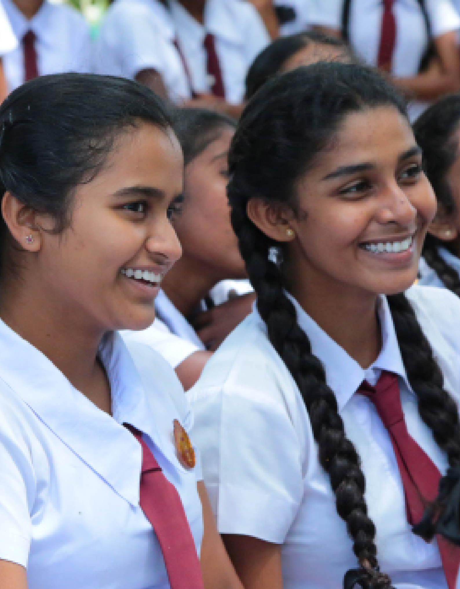
Picture 15: Sri Lanka Forum Theatre Programme - Phase IV / Vavuniya District