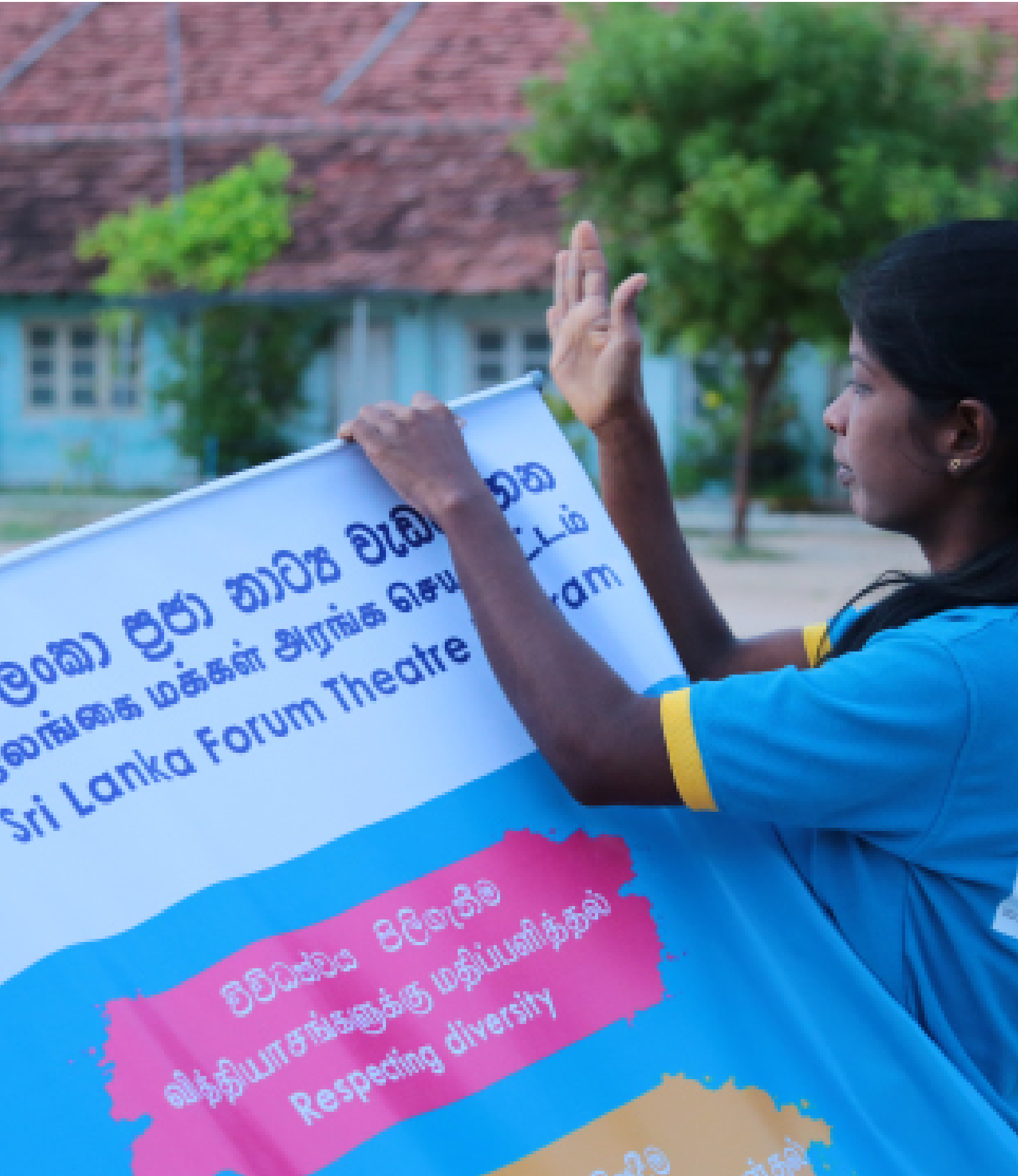
Picture 18: Sri Lanka Forum Theatre Programme - Phase IV / Mannar District / Photo by: Alexanther Kamilas