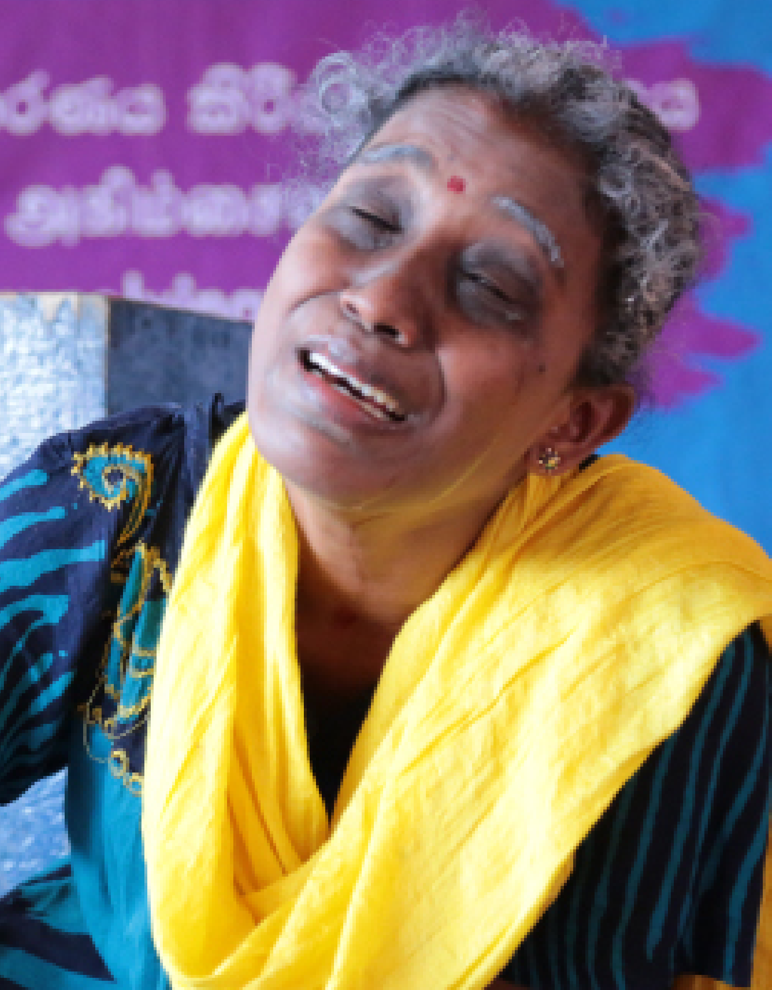
Picture 14: Sri Lanka Forum Theatre Programme - Phase IV / Kilinochchi District / Photo by: Alexanthar Kamilas