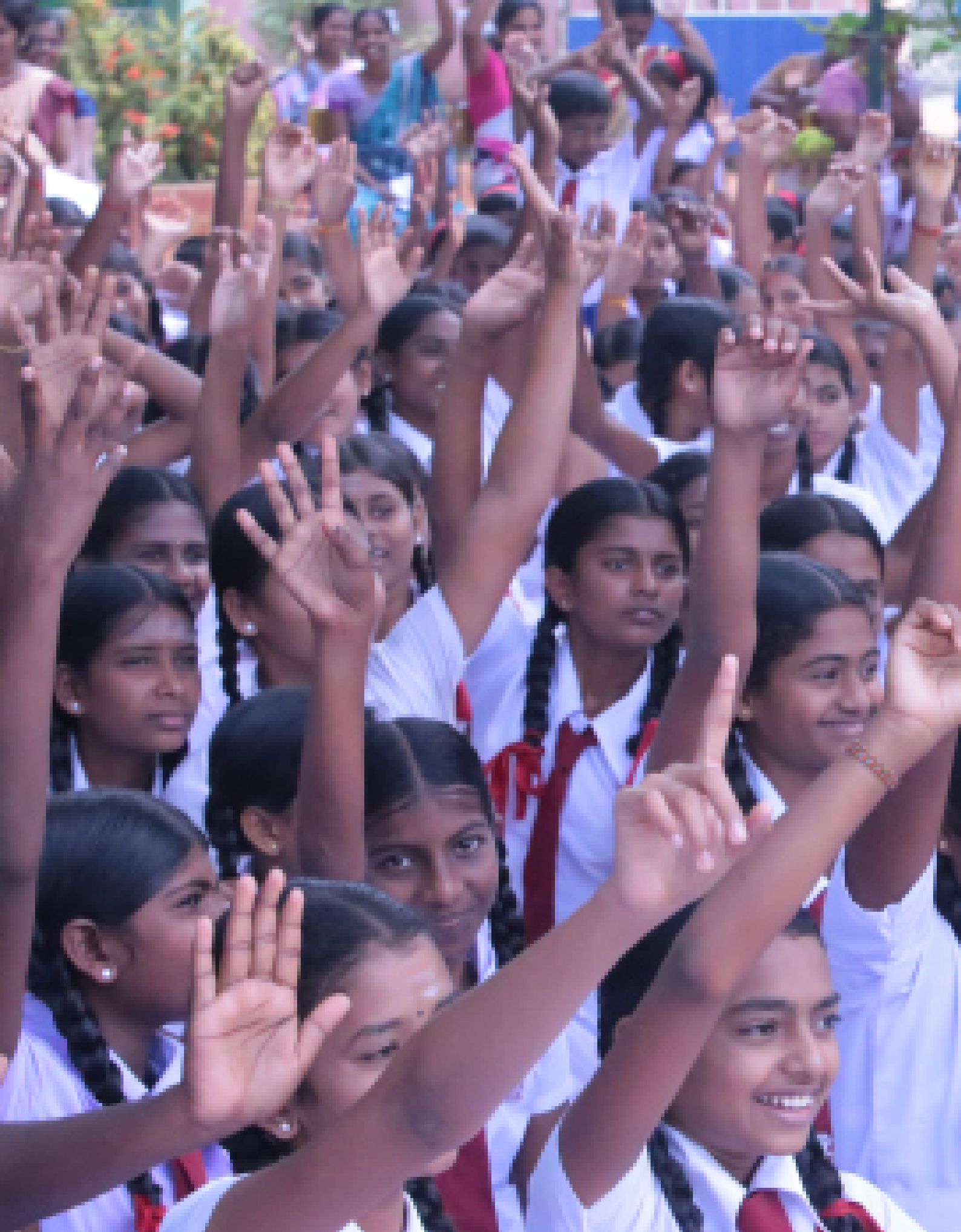
Picture 12: Sri Lanka Forum Theatre Programme - Phase IV / Kilinochchi District