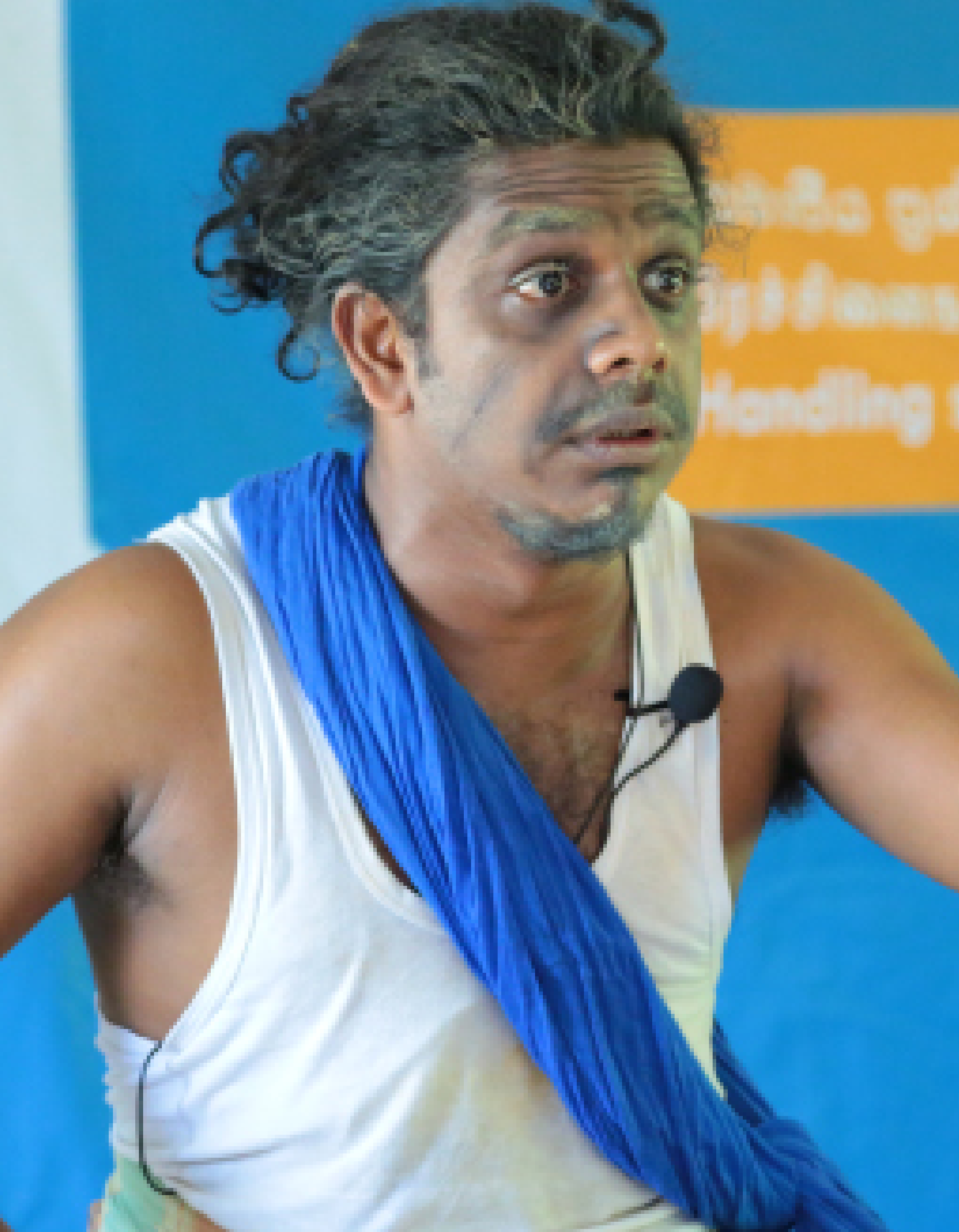
Picture 10: Sri Lanka Forum Theatre Programme - Phase IV / Vavuniya District