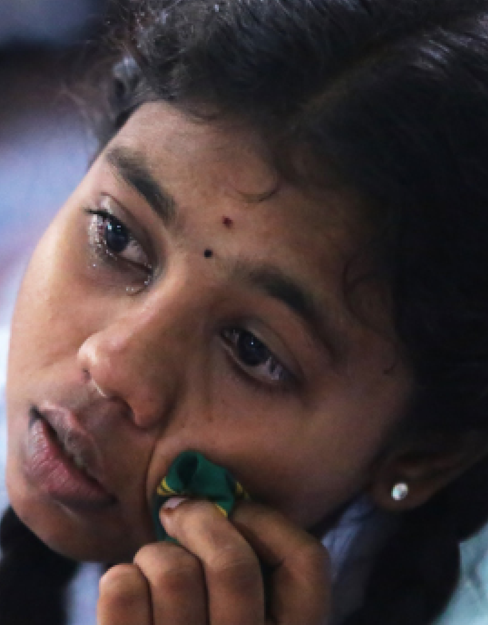
Picture 04: Sri Lanka Forum Theatre Programme - Phase IV / Jaffna District