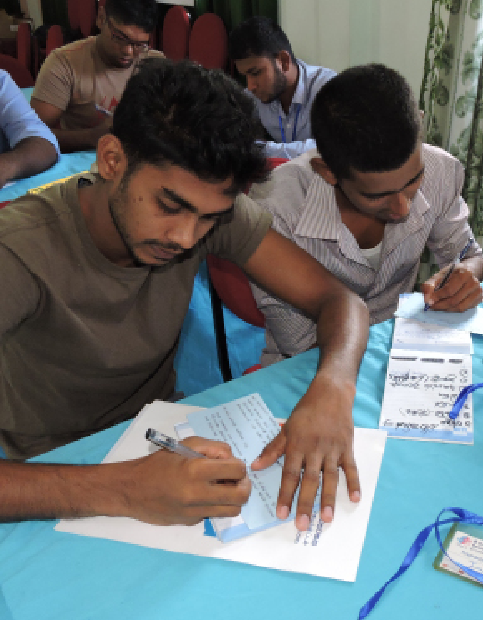
Picture 13: Sri Lanka Forum Theatre Programme - Phase II / Training Workshop