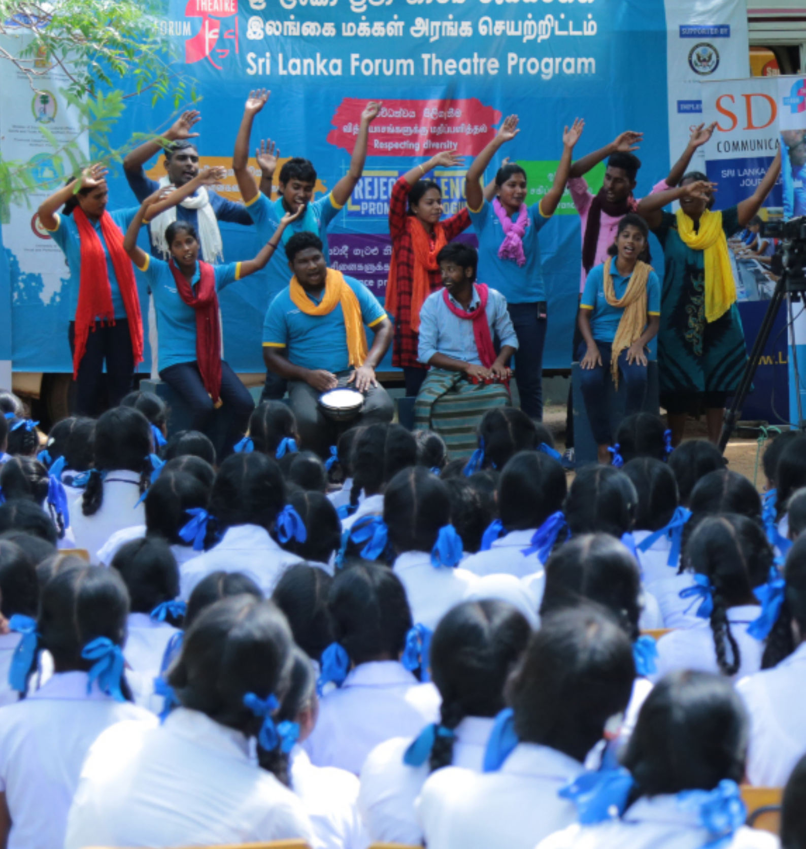
Picture 01: Sri Lanka Forum Theatre Programme - Phase IV / Vavuniya District